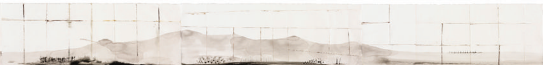
Denis Riva, Spiegare il paesaggio